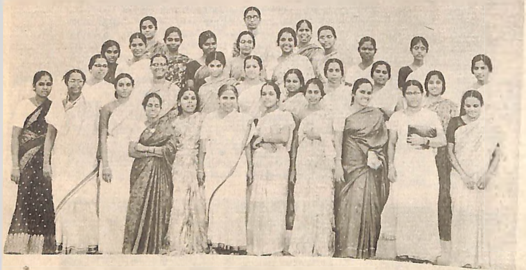
மாணவிகள் அல்ல, ஆசிரியைகள்

அடுத்து 'ஹோம் சயன்ஸ்' சமையலறைக்கு அழைத்துச் செல்லப்படுகிறோம். யாரோ தெரிந்தவர்களின் வீட்டுக்குள் நுழைவது போல் தோன்றுகிறது. அங்கே